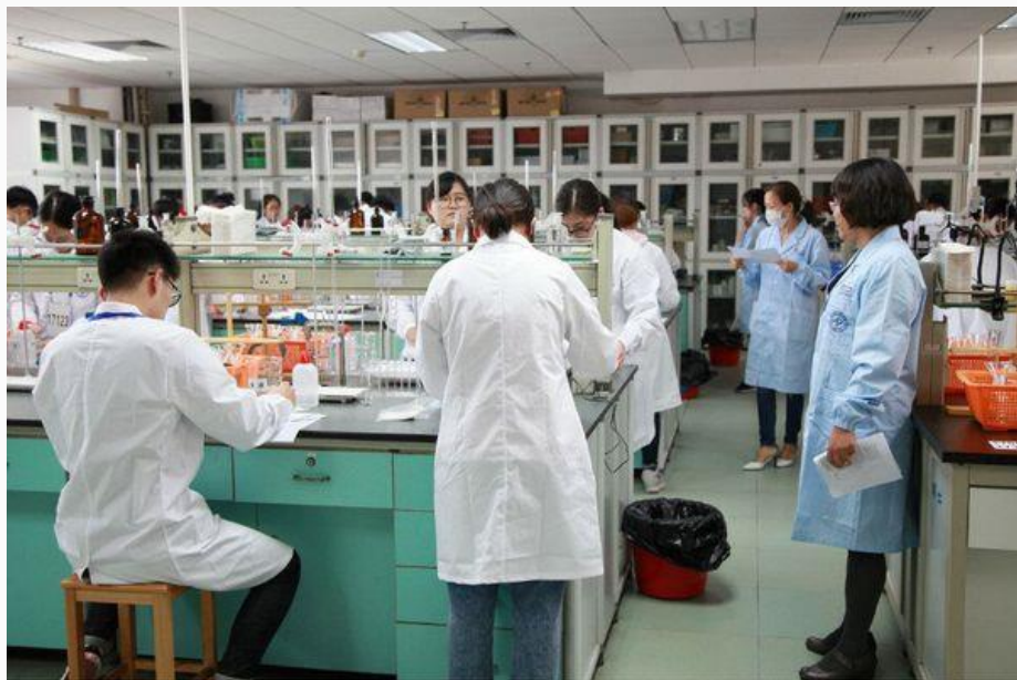
全国医药院校药学/中药学专业大学生实验技能竞赛