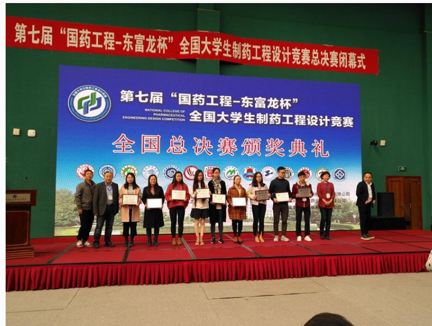
全国大学生制药工程设计竞赛