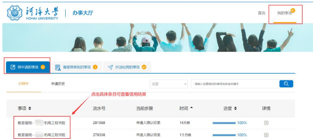
图 4 借用进度和结果查询

申请填写完毕, 点击页面左上方的“提交”按钮提交, 会进入审批环节, 可以在“办事大厅”——“我的事项”——“我申请的事项”界面点击相应条目查看确认流程进度和教室安排结果。(见图 4)