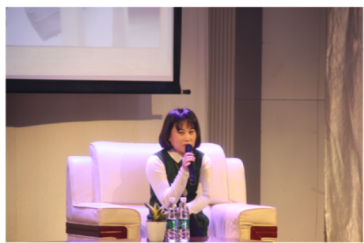
辛夷坞“青春十年， 我们相伴”创作分享会