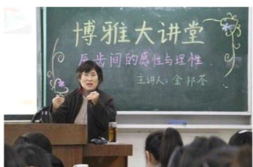
金邦荃教授“唇齿间 的感性与理性”